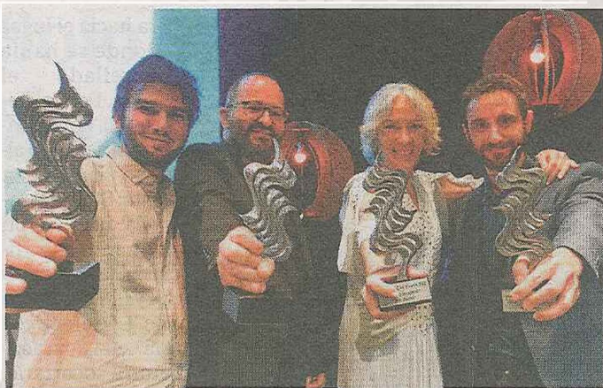
Lucas Vidal, Fernando González Molina, Susi Sánchez y Dani Rovira (de izquierda a derecha)