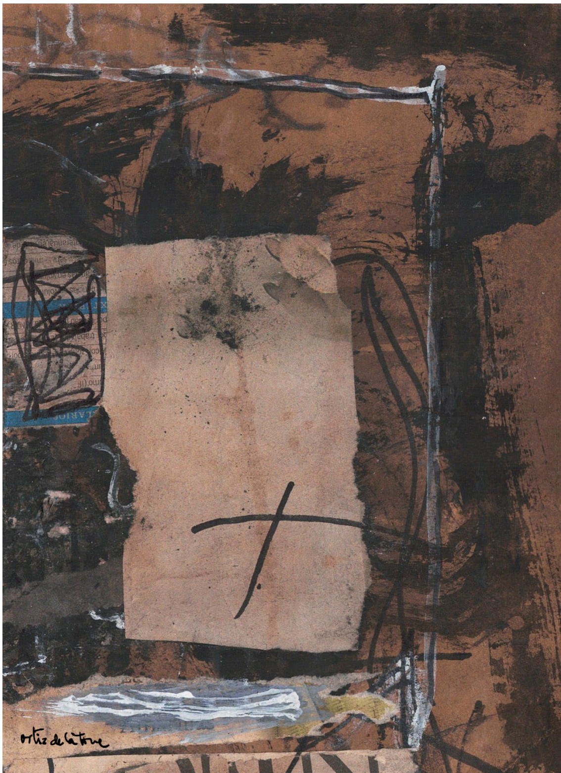
Tomás Ortiz de la Torre, José Antonio. Ventanal . Madrid, 2024. Collage papel sobre cartón. 18,6 cm x 13,7 cm.