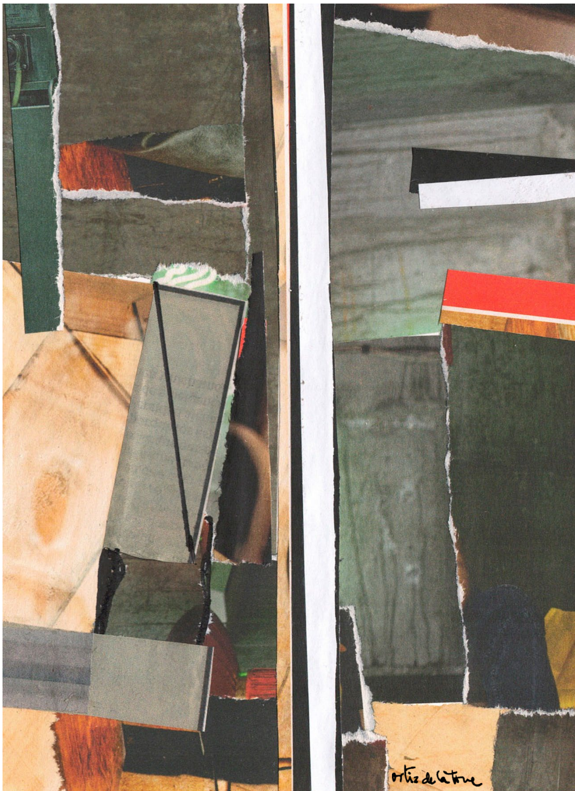
Tomás Ortiz de la Torre, José Antonio. Sendas . Madrid, 2024. Collage papel sobre cartón. 19 cm x 14 cm.