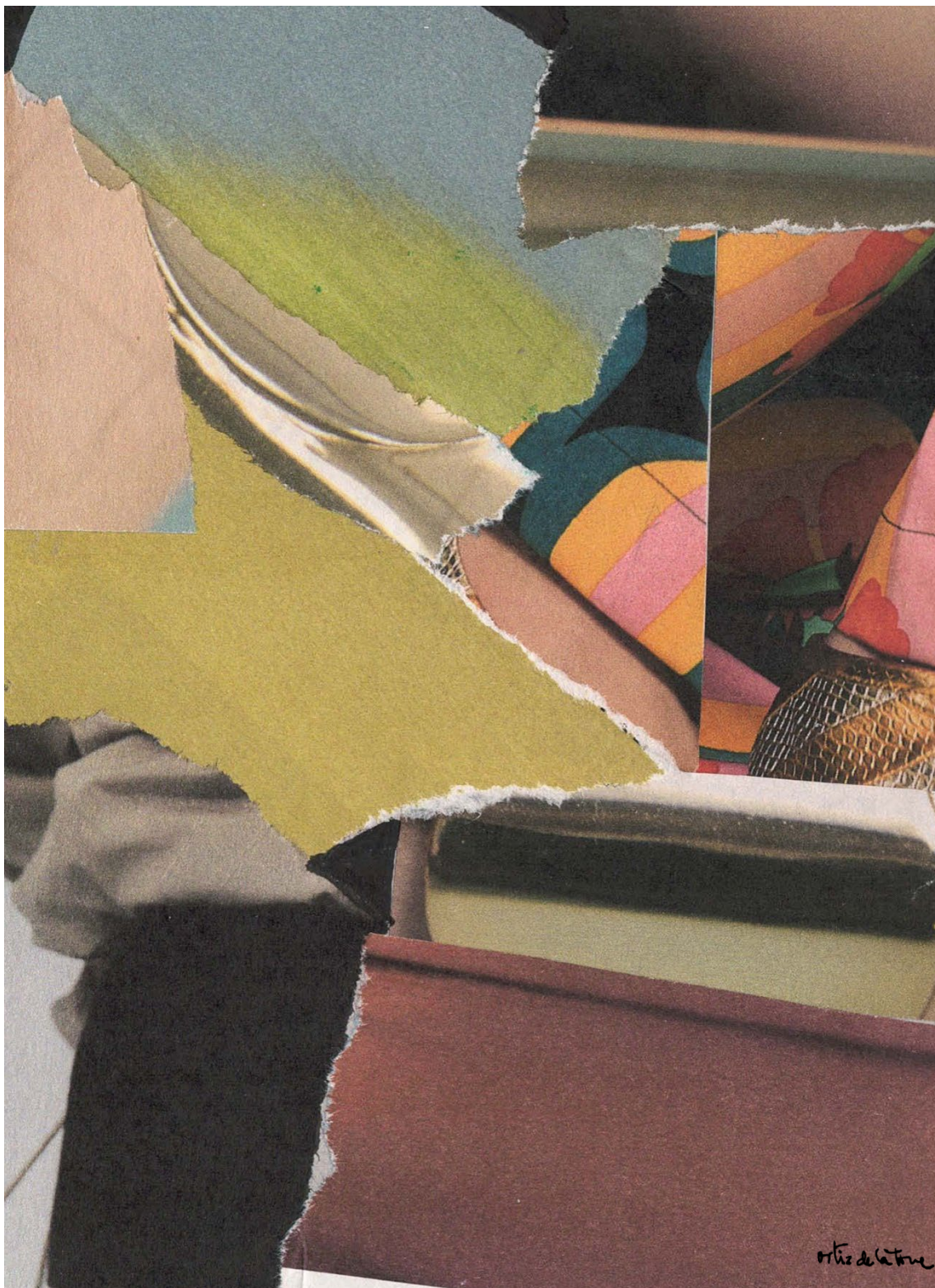
Tomás Ortiz de la Torre, José Antonio. Sin título. Madrid, 2024. Collage papel sobre cartón. 18,9 cm x 14,1 cm.